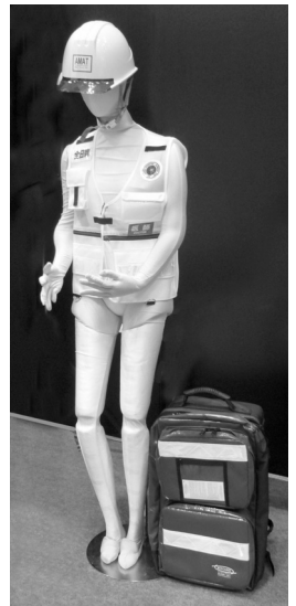
▲AMATの推奨ユニフォーム(ベストとヘルメット=写真)はAMAT研修で支給される

登録者の資格更新は5年ごとに行われる。また、資格の更新要件については救急・防災委員会が定める事としている。このAMAT研修を受講された隊員には自院での啓蒙活動に日々注力頂きたいと思っている。