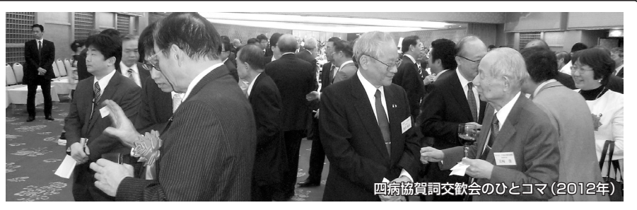
四病協賀詞交歓会のひとコマ(2012年)