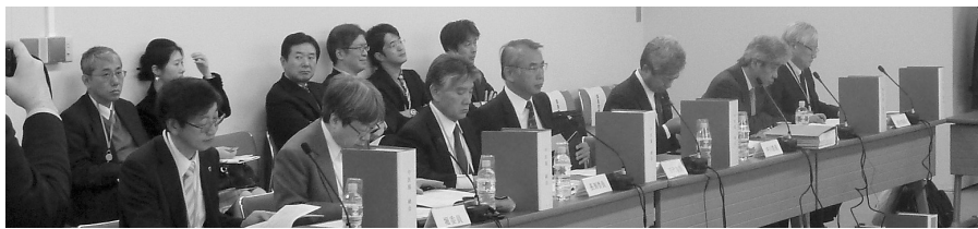
▲診療側は7対1 特定除外制度の全面廃止に反対した

「小児がん拠点病院」はすでに15医療機関が指定済。「特定領域がん診療病院」は全国で20病院と見込んでいるが、「地域がん診療病院」の数には「現時点では推定の域を出ない」との説明があった。支払側と診療側からは、特