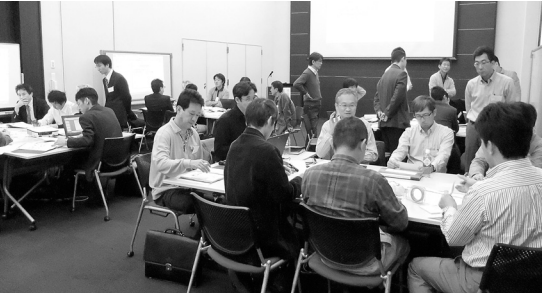
▲2013年度の指導医講習会

全日病・医法協の「臨床研修指導医講習会」は来年10回目を迎える。本講習会のコンセプトの見直しを含め検討し、より良い講習会にしていくつもりである。来年も11月に開催予定であるので、是非周りの人への参加を勧めて欲しい。