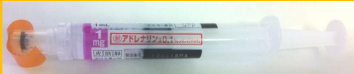
アドレナリン注 0.1%シリンジ

筋肉内注射後15分たっても改善しない場合、また途中で悪化する場合は追加投与を考慮する。