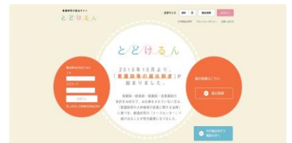
「とどけるん」のトップページ